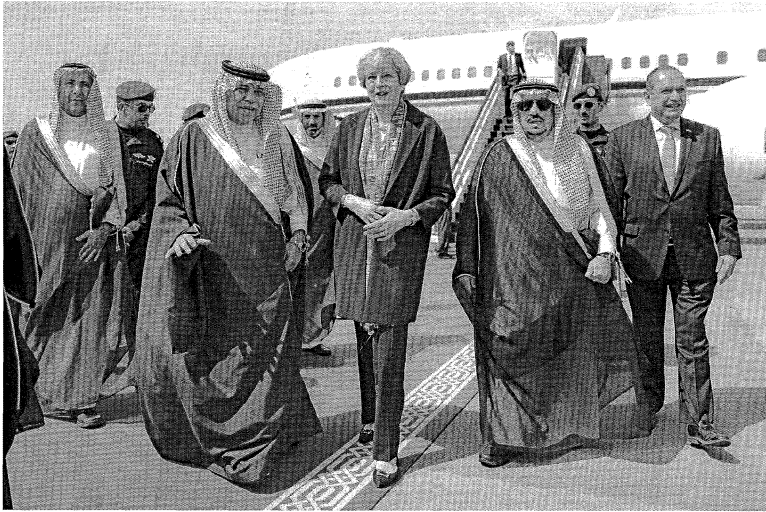
Рис. 3. Визит Т. Мэй в Саудовскую Аравию

Меланья Трамп – супруга президента США – приехала в Саудовскую Аравию с непокрытой головой: в ходе визита Дональда Трампа в Эр-Рияд первая леди США продемонстрировала солидарность с женщинами – лидерами западных стран, которые отказываются следовать мусульманским традициям (рис. 4) [22].