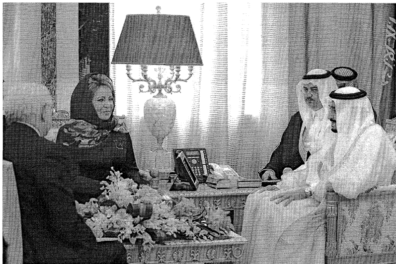
Рис. 5. В.И. Матвиенко в Саудовской Аравии

Председатель Совета Федераций Валентина Матвиенко, наоборот, полагает, что следует чтить традиции мира Востока (рис. 5) [22].