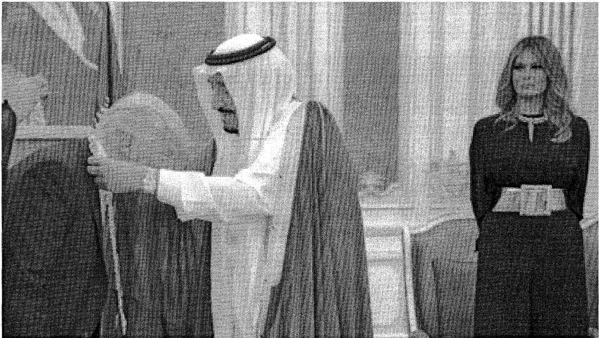
Рис. 4. М. Трамп в Саудовской Аравии

Меланья Трамп – супруга президента США – приехала в Саудовскую Аравию с непокрытой головой: в ходе визита Дональда Трампа в Эр-Рияд первая леди США продемонстрировала солидарность с женщинами – лидерами западных стран, которые отказываются следовать мусульманским традициям (рис. 4) [22].