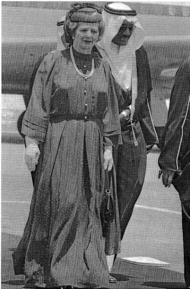
Рис. 2. Визит М. Тэтчер в Саудовскую Аравию

Тереза Мэй – премьер-министр Великобритании (2016–2019.), понимавшая, что ее будут сравнивать всегда с М. Тэтчер, отказалась покрыть голову во время визита в Саудовскую Аравию, хотя эксперты британского МИД советовали ей надеть традиционное арабское платье и платок. Однако Т. Мэй заявила, что не собирается следовать местной традиции, так как хочет, чтобы ее граждане увидели в ней лидера. Как призналась Т. Мэй, она надеялась показать жительницам Саудовской Аравии, «чего может достичь женщина». Премьер появилась на трапе самолета в европейском брючном костюме с непокрытой головой (рис. 3) [49].