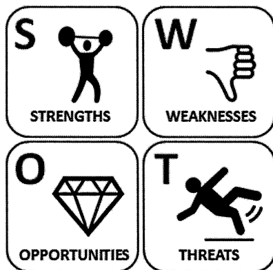
Рис. 1. SWOT-анализ

Одним из часто применяемых методов при решении кейсов служит SWOT-анализ – метод, позволяющий выявить сильные и слабые стороны в развитии ситуации и ее внешний контекст (рис. 1). Несмотря на то, что метод подвергается критике, он продолжает активно использоваться в политической аналитике и прогностике политических ситуаций. Обусловлено это тем, что метод SWOT-анализа предполагает, во-первых, выявление внутренних сильных и слабых сторон ситуации, а также внешних возможностей и угроз и, во-вторых, установление связей между ними.